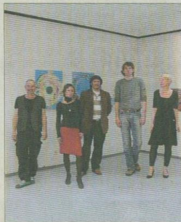
Auf Beuys Spuren: Mitglieder der Kunststation.

OBERKASSEL. „Nachtgedanken“, „Papier“ oder „aisha“ heißen einige der rund 70 Objekte der Ausstellung